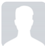
Audun Fredriksen Salg / Service ski & sykkel