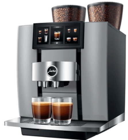
Jura Giga W10

I elegante, representative arbeids-, fritids- og loungeomgivelser er det innovasjon, ytelse og design som teller. Brukervennligheten er like viktig som funksjonaliteten: Menyene er klart utformet, navigasjonen er intuitiv og den intelligente kopsensoren Coffee Eye garanterer sikker håndtering for kaffeelskere.